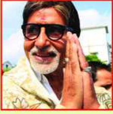
સહીના મહાનાયક શ્રી. અમિતાભ બચ્ચન