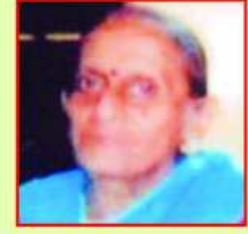
અનેક મુશ્કેલીઓ સામે દ્રઢતાથી ઝગમગનાર મારી જીવનસંગીની પ્રભાને